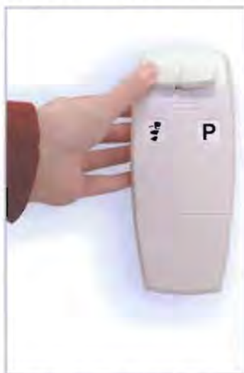
Tilkalling av stolheisen.