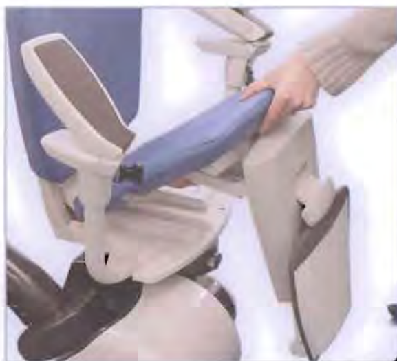
Slå setet opp/ned.