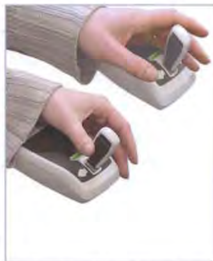
Hold joysticken i kjøreretningen under hele turen.